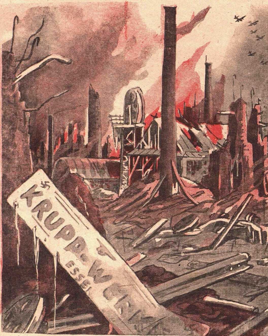
Разукрупнение немецкой промышленности